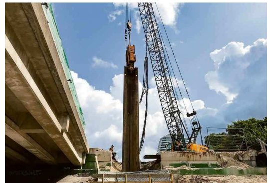
Het intrillen van damwandplanken voor de aanleg van de Zuidelijke Ringweg veroorzaakte overlast in de aangrenzende woonwijken.

In de woonwijken dicht bij de ringweg, zoals de Oosterpoort en de