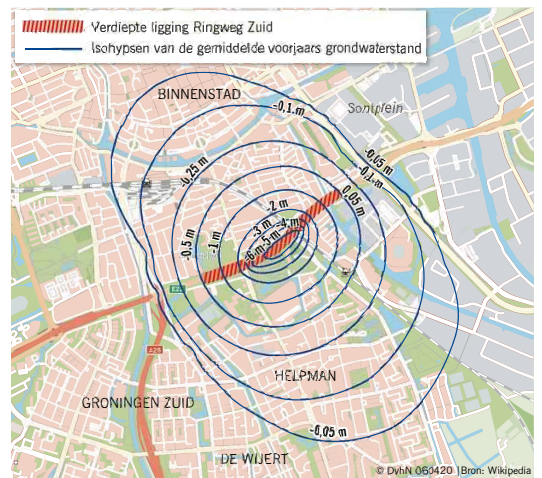
Het verlagen van de grondwaterstand is vooral ingrijpend in de directe omgeving van de Zuidelijke Ringweg. ILLUSTRATIE GRONINGEN VERDIENT BETER